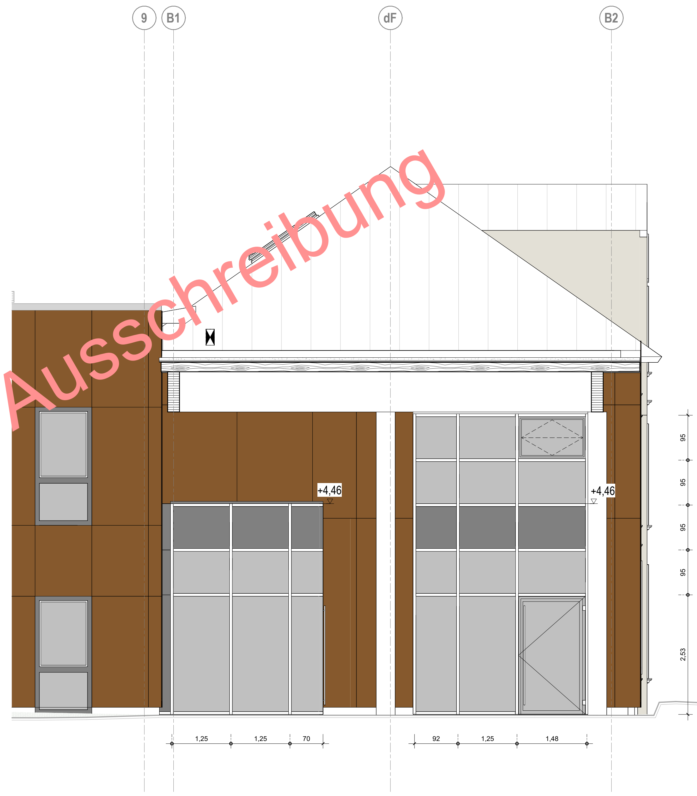
AN_DT_PR-Fassade M 1 : 50

Nur zur Verwendung für die Ausschreibung